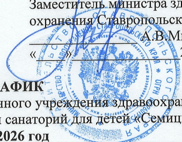
ГРАФИК заездов государственного казенного учреждения здравоохранения Ставропольского края «Краевой санаторий для детей «Семицветик» на 2026 год